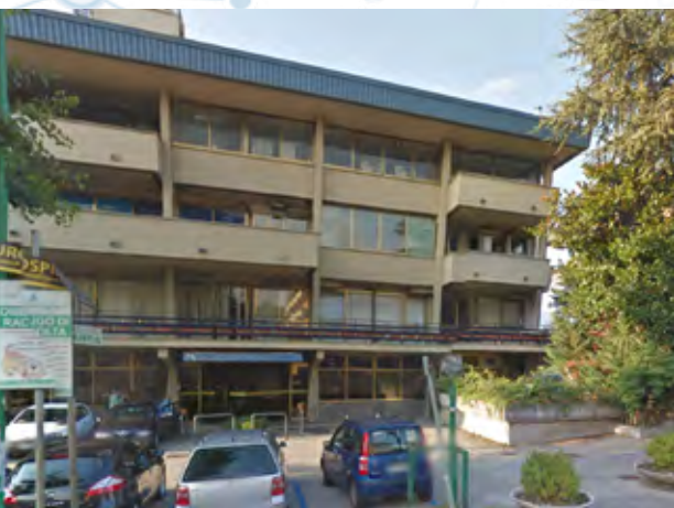
Hub e Spoke: Diagnostica Medica s.r.l. LABORATORIO ANALISI Via Nazionale, 146 83013 Mercogliano

la nostra rete di laboratori per rispondere alle esigenze dei nostri pazienti