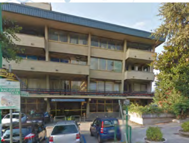
Hub e Spoke: Diagnostica Medica s.r.l. LABORATORIO ANALISI Via Nazionale, 146 83013 Mercogliano

la nostra rete di laboratori per rispondere alle esigenze dei nostri pazienti