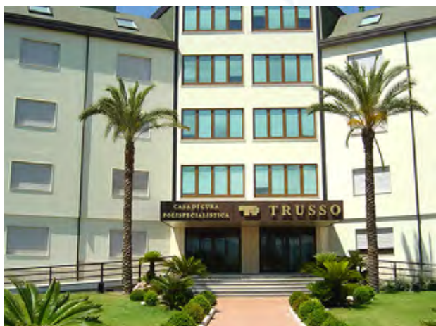
Spoke: Casa di Cura Trusso CARDIOMED S.P.A. UNIPERSONALE LABORATORIO ANALISI Via San Giovanni Bosco, 3 80044 Ottaviano (NA)